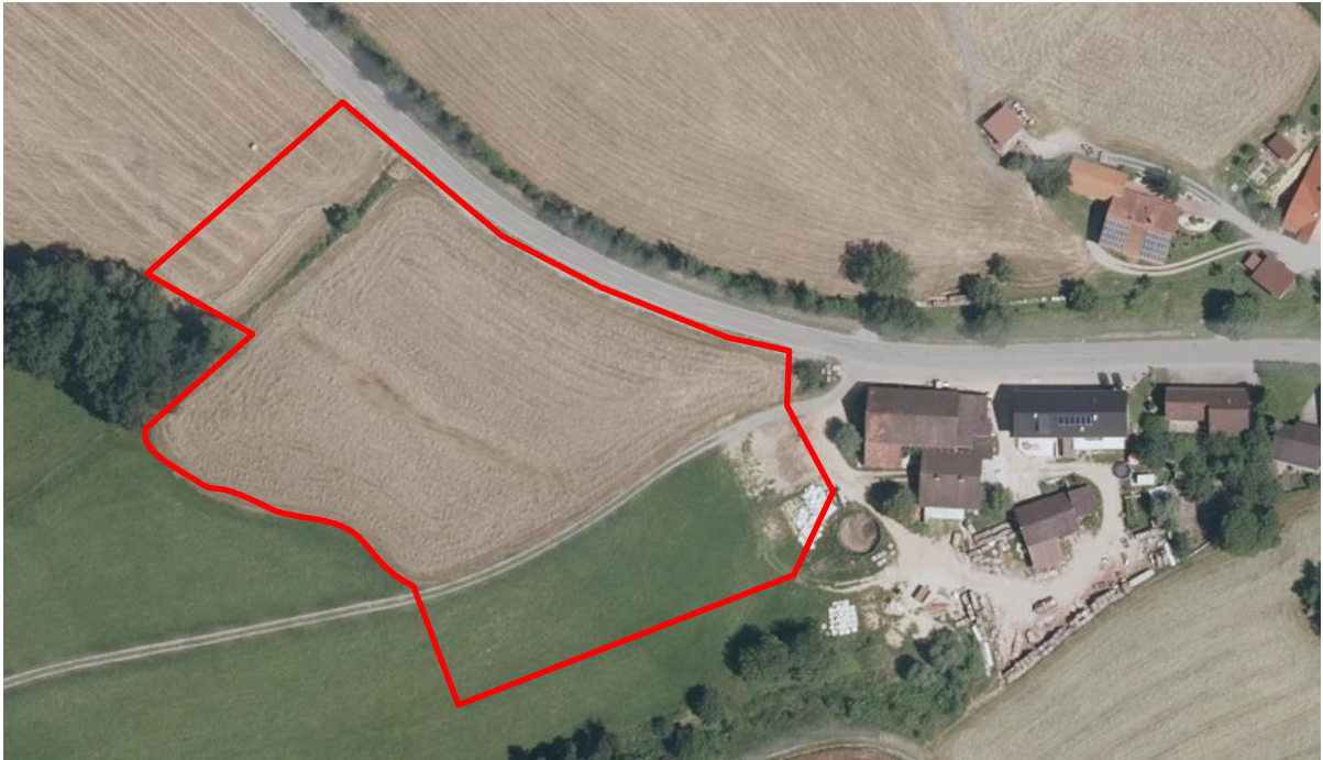
Luftbildausschnitt aus dem BayernAtlas, Stand vom September 2017 – ohne Maßstab